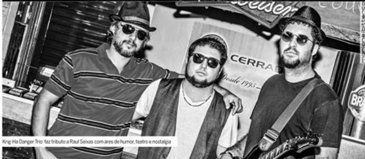
Krig-Ha Danger Trio faz tributo a Raul Seixas com ares de humor, teatro e nostalgia