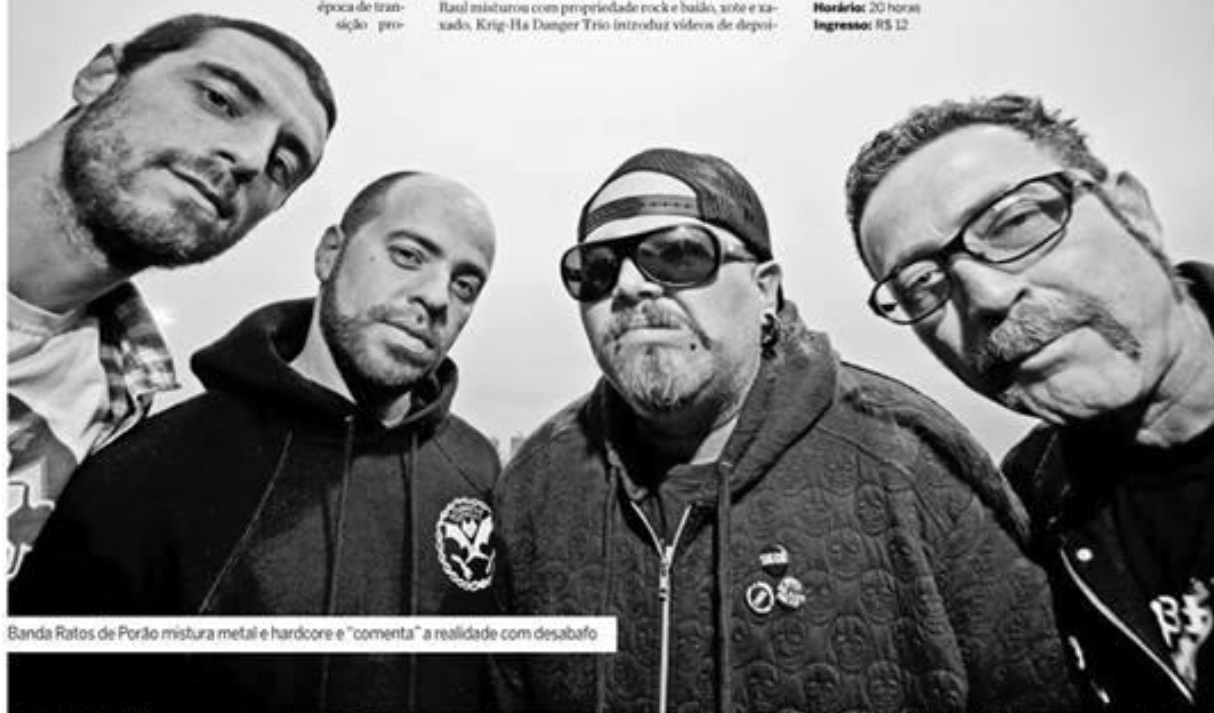
Banda Ratos de Porão mistura metal e hardcore e "comenta" a realidade com desabafo