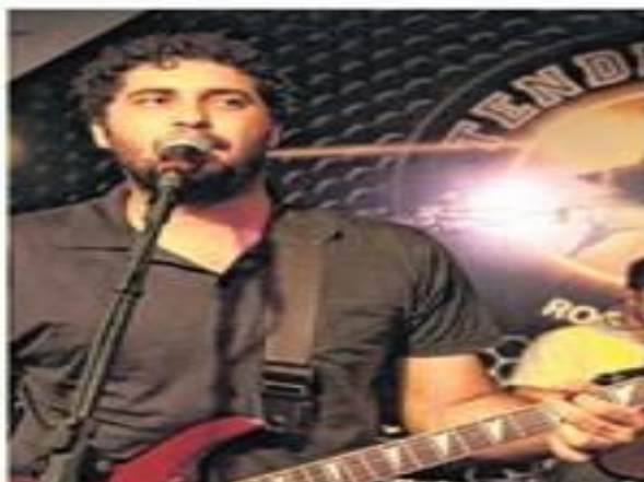
Krig Ha Danger Trio vai relembrar o rock das décadas de 1960 e 1970. Elvis será o grande homenageado