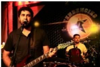
Trio Krig-Ha Danger homenageia o roqueiro baiano

O Teatro Goiânia, unidade da Secretaria de Estado da Cultura de Goiás (Secult), recebe neste sábado (4), o grupo Krig-Ha Danger, com o espetáculo em tributo a Raul Seixas "10dobramentos de Raul". A apresentação traz uma releitura apresentada em dez facetas relacionadas à vida e carreira do músico.