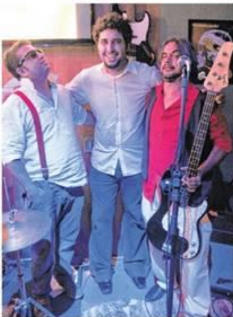
Grupo promete passeio pelas três décadas (50, 60 e 70) que mudaram a história do rock

O trio Krig Ha Danger homenageia Raul Seixas e promete apresentação eletrizante e no Dark Sunday