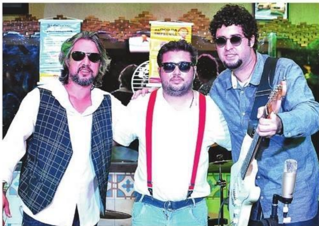
Grupo promete passeio pelas três décadas (50, 60 e 70) que mudaram a história do rock